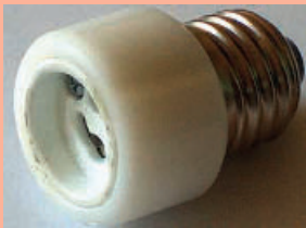
10 230-V-Adapter für die Umrüstung herkömmlicher Leuchten auf Halogenlampen Quelle: Halo-Light