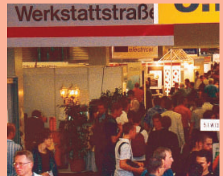
❸ Angebote in der Werkstattstraße wurden vom Elektro-Nachwuchs rege angenommen