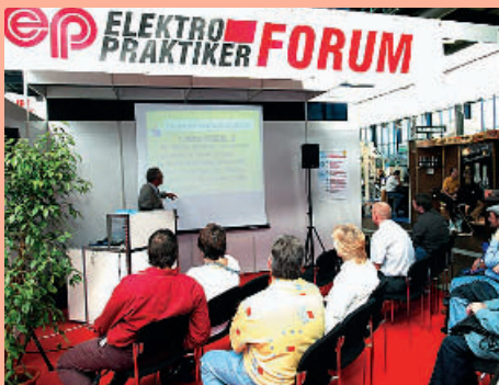
❶ Komprimiertes Fachwissen wird von hochkarätigen Experten präsentiert (z. B. zum Thema „Branchensoftware“)

Leitungssucher für Wand und Erdreich. Das im Bild ❹ gezeigte Leitungssucher-Set, bestehend aus Geber und Empfänger, eignet sich u. a. zum Auffinden von Leitungsunterbrechungen, Leitungsverläufen