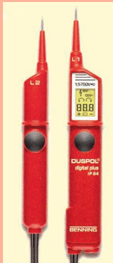
6 Neue Generation DUSPOL-Spannungsprüfer