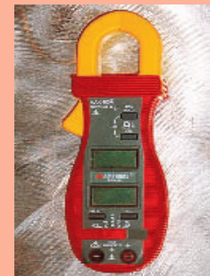
8 Digitale Stromzange 400 A mit Dualanzeige