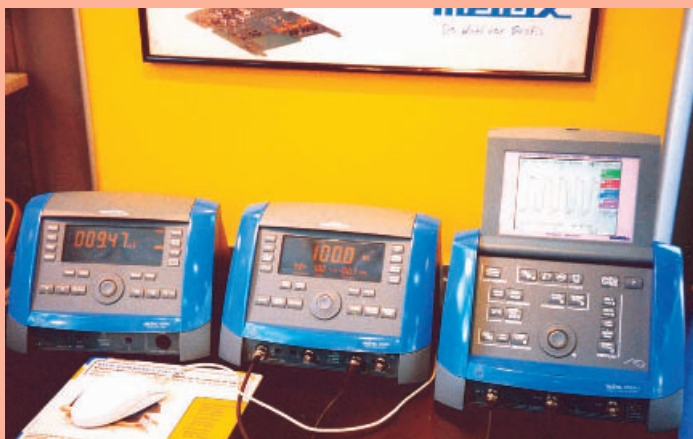
9 Design und Form helfen Platz sparen – MTX Compact

(v.l.n.r. Multimeter-Analysator, Funktionsgenerator mit Messfunktion und Oszilloskope mit Analysefunktion)