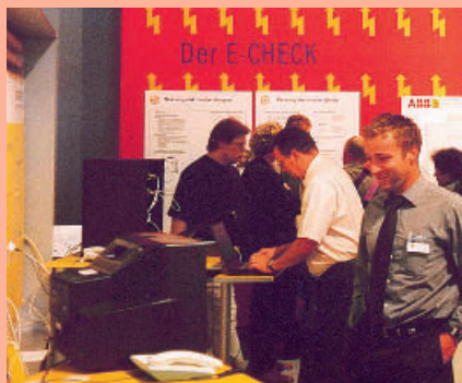
❷ Sonderschau „Innovative Technik – neue Märkte“: Großer Besucherzulauf deutet auf richtige Themenauswahl hin