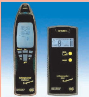
4 Zuverlässige Leitungsverfolgung von Erdkabeln