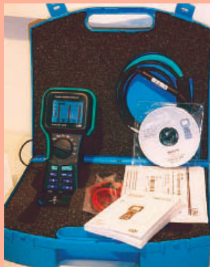
7 Messwerkzeug zur Analyse von Netzqualitätsproblemen