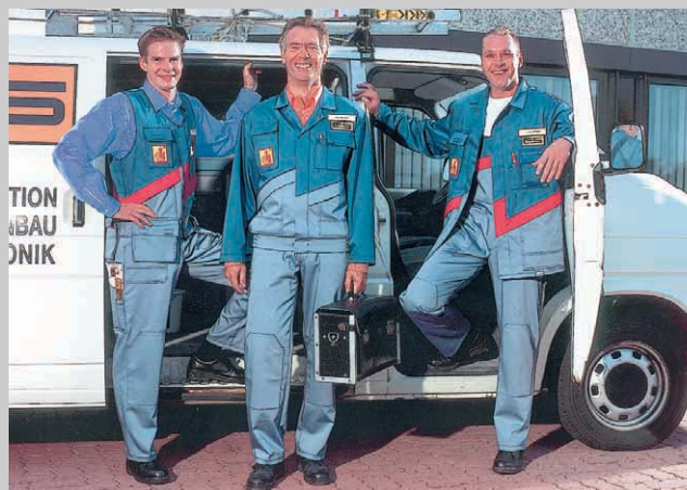
2 Gewerkespezifische Berufsbekleidung entwickelt Boco gemeinsam mit Verbänden – hier die Imagekleidung des ZVEH