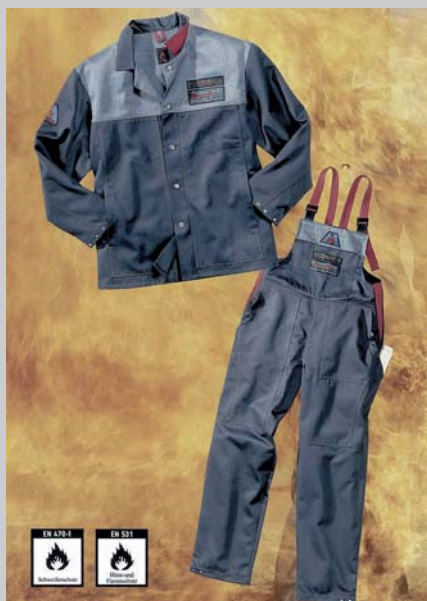
Ö Die Schweißer- und Flammenschutzkleidung „proFlex4“ erfüllt die Normen EN 740-1 und EN 531

logos und Namen auf die Bekleidung aufgebracht werden. Für die Elektrohandwerke haben wir ein abgestuftes Angebot je nach Beanspruchung und Investitionsbereitschaft entwickelt.