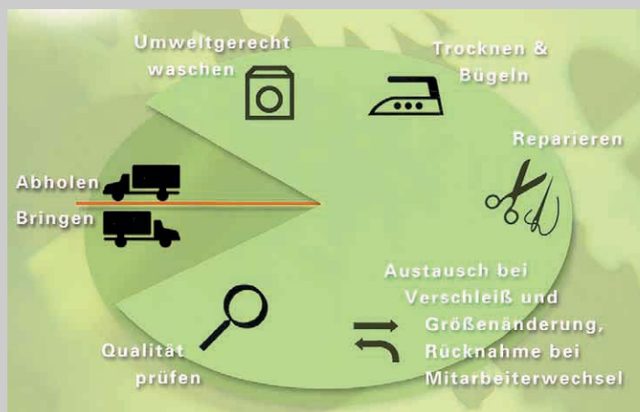
1 Der Mietservice für Berufsbekleidung umfasst das komplette Handling und entlastet kleine und mittlere Unternehmen

Darüber hinaus verfügen wir über ein großes Sortiment an Berufsbekleidung, welches in jeder Hinsicht individualisiert werden kann. So können beispielsweise Firmen-