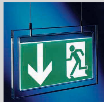
6 Rettungszeichenleuchte SPIRIT