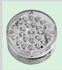
2 LED-Modul LEDLUX® auf Netzspannungsbasis

keverteilung und eine minimale Blendwirkung. Sie sind in den Farben weiß, grün, blau, zyan, rot, rotorange und bernstein verfügbar.