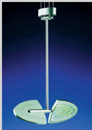
4 Pendelleuchte LED'S FLY®