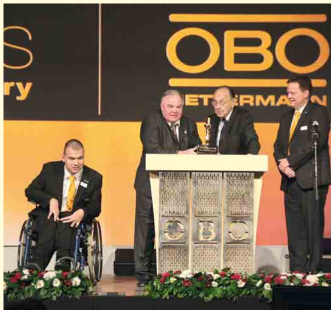
Preisverleihung auf der 20-Jahr-Feier der ungarischen OBO-Tochter in Bugyi bei Budapest