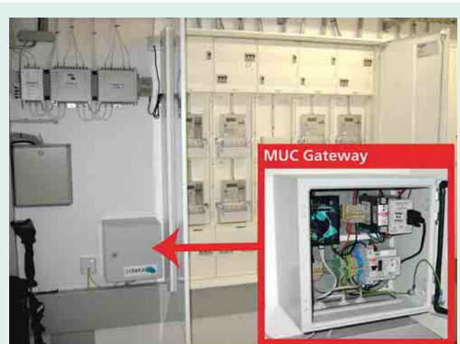
2 Multi Utility Communication (MUC)-Gateway in einem Hausanschlussraum in der Wohnanlage Bamlach – hier findet die Kommunikation zwischen Stromzählern und Servicedienstleistern statt

tern. Der Server kann z. B. in der Trafostation des Niederspannungsnetzes installiert werden und so alle beteiligten Anbieter wie Messdienstleister, Stromhändler und Netzbetreiber über redundante Internetverbindungen vernetzen. In der Praxis kann also ein übergeordneter virtueller Kraftwerksbetreiber die Steuerung der Erzeuger und Lasten übernehmen oder es erfolgt eine indirekte Anforderung durch variable Tarife.