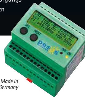
Made in Germany

Von den führenden Energieversorgungsunternehmen empfohlen!