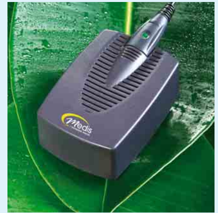
3 Ladegerät für den einmaligen Gebrauch

Mit führend im Bereich der mobilen Brennstoffzellen-Telefonie ist derzeit Toshiba. Der asiatische Konzern entwickelte ein System, dessen Mikro-Brennstoffzelle eine Dauerleistung von 300 mW bietet, wobei das Methanol