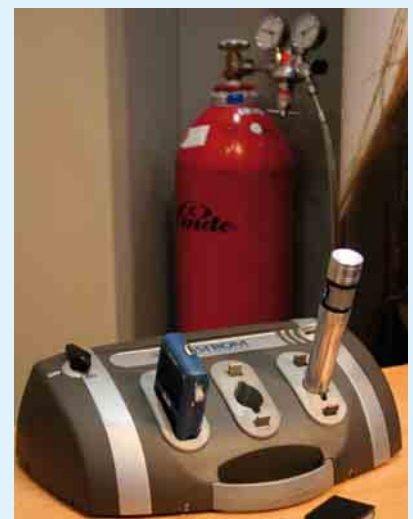
1 Ladestation von Angstrom für Palm und Taschenlampe

Neues kommt auch von der 4. Hydrogen and Fuel Cell Expo, die vom 27. bis 29. Februar 2008 in Tokio stattfand. MTI MicroFuel Cells stellte dort den neuen Prototyp einer mobilen Brennstoffzelle für Digitalkameras vor. „Digitalkameras machen das zweitgrößte Umsatzsegment im Verbrauchermarkt für Lithium-Ionen-Akkus aus“, sagte Peng Lim, CEO von MTI. „Angesichts der immer fortgeschritteneren Funktionen, mit denen neue Modelle ausgestattet sind, wie zum Beispiel Videoaufnahmen und deren Wiedergabe, gewinnt die