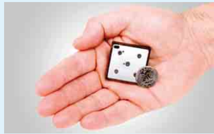
2 DMFC-Chip für den Kameragriff

Auch im hohen Norden wird an Mikrobrennstoffzellen gearbeitet. In Stockholm arbeitet myFC an Kleinsystemen, die für mobile Anwendungen (z. B. Mobil-Telefone, mp3-Player) geeignet sein sollen. Das Kerngeschäft der Schweden ist die Entwicklung des Fuel-Cell-Stickers, eines Energiewandlers basierend auf der Brennstoffzellentechnik, der mit Wasserstoff – unabhängig von dessen Feuchte – arbeitet. Das erste präsentable Produkt ist der 1636-Chip, der extrem dünn und flexibel ist und ganz ohne Pumpen oder Kühlelemente auskommt. Diese Chips (16 mm × 36 mm × 2,6 mm; Nennleistung: 0,6 W bei 0,6 V) sind bereits kommerziell erhältlich und werden als Paket in einer 4-Zellen-Konfiguration angeboten (2,4 W bei 2,4 V). Die ersten Erfahrungen damit waren nach Auskunft von Anders Landblad, CTO von myFC, durchaus zufriedenstellend, sodass jetzt bis zu 50 W angepeilt werden. Im November 2007 erhielt myFC für seine FuelCellStickerTM-Technik während der Mobile-Future-Konferenz den Innovation-of-the-Year-Award. Das Gerät wurde als besonders günstig in der Herstellung, besonders einfach in der Fertigung und besonders effizient im Betrieb dargestellt. Der so genannte Goldmobilen-Preis wird alljährlich während der Mobile-Gala (Mobilgalan) an die innovativsten Unternehmen Skandinaviens im Bereich kabellose Geräte verliehen. Gemeinsam mit