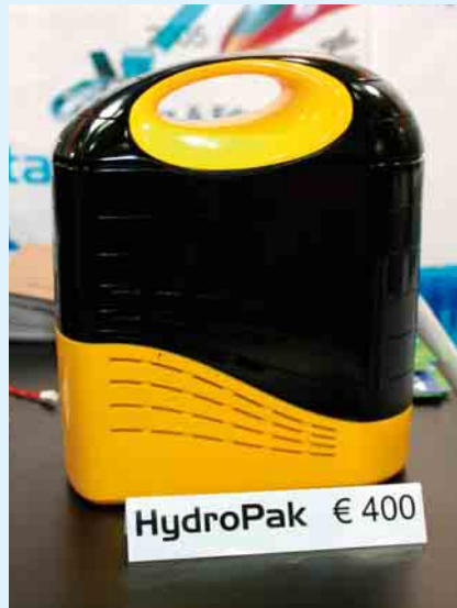
6 Voraussichtlich ab November 2008 auf dem Markt