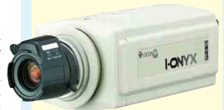
③ IP-Kamera mit integrierter 100 Mbps-LAN-Karte

Bei „offenen“ Videosystemen wird mit dem Erwerb des Systems auch die Lizenz für einen bestimmten Ausbaugrad erworben. Eine Erweiterung bzw. ein Ausbau des Systems ist im