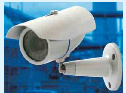
④ leistungsstarke Kamera mit DC- Vario-Objektiv