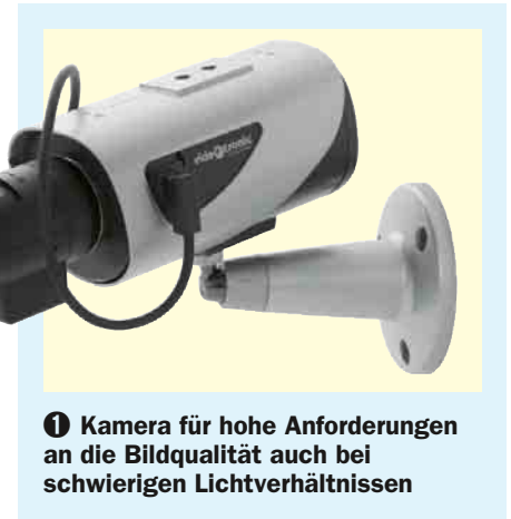
1 Kamera für hohe Anforderungen an die Bildqualität auch bei schwierigen Lichtverhältnissen

Der Videoüberwachungsmarkt bietet heute ein sehr breites Sortiment an Systemen und Geräten der Netzwerk-Videotechnologie an. Planer, Errichter und Endkonsumenten nutzen dabei zunehmend die Möglichkeit, die Vorzüge der analogen Videotechnik mit innovativen Funktionen zu verbinden. Das wurde erst durch die Digitaltechnik machbar. Mit Netzwerk-Video ist es möglich, über ein vorhandenes IP-Netzwerk – LAN/WLAN/Internet – Video zu übertragen und aufzuzeichnen.