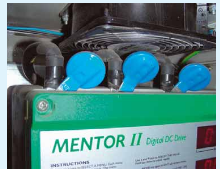
11 Sehr oft einzige, nicht fachgerechte Überspannungsschutzmaßnahme an Photovoltaikanlagen

In anderen Fällen, z. B. gemauerten Gebäuden, muss auch die Fangeinrichtung um den Trennungsabstand vergrößert werden. Die Installationen sind z. B. mit ISO-Distanzhalter ausgeführt (Bild 7). Die Fangspitzen sind auf den „ISO-Fangstangen“ installiert. Dadurch ist überall der Trennungsabstand vergrößert. Beim konkreten im Bild 7 dargestellten Fall sind die Fangspitzen an den „ISO-Fangstangen“ befestigt; nach dem Blitzkugelverfahren wird das gesamte Dach geschützt.