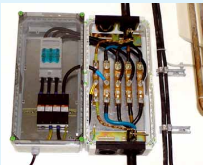
9 Installierte Blitzstromableiter bei Gebäudeeintritt