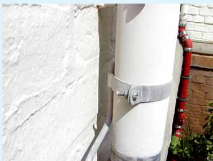
4 Nicht fachgerechter Regenfallrohranschluss