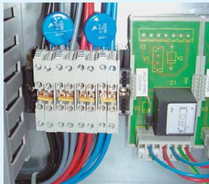
13 Es gibt Firmen, die auch auf diese Art und Weise Überspannungsschutzmaßnahmen ausführen, die jedoch nicht fachgerecht sind