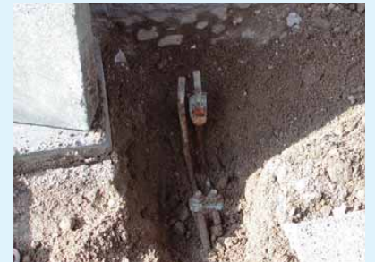
2 Ableitung und Erder unterhalb der Trennstelle sind kurzgeschlossen