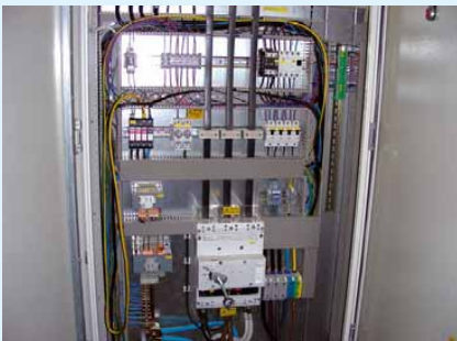
12 Der Monteur hatte wahrscheinlich keinen Seitenschneider und musste die Leitungsüberlänge im Rangierkanal „verstecken“