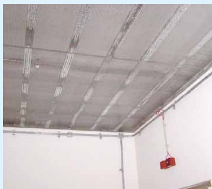
15 Nachträglich geschirmter Raum