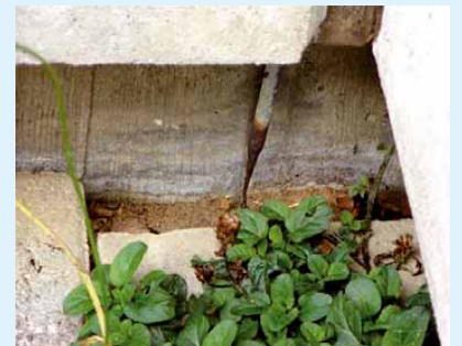
3 Durchgerostete Erdereinführung ohne Korrosionsschutz