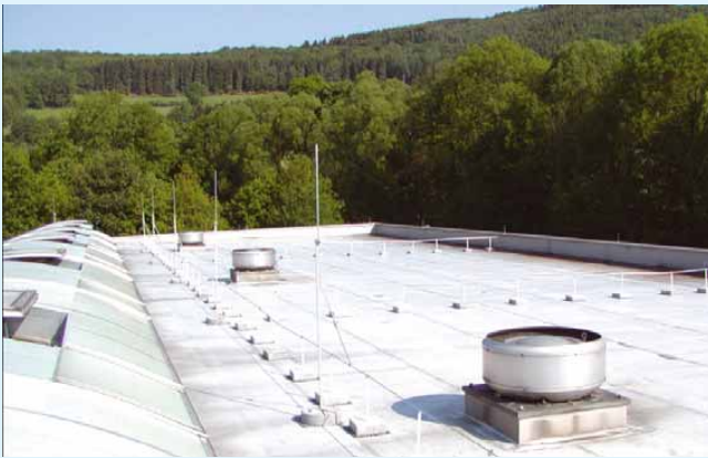
7 Eine höherliegende Fangeinrichtung