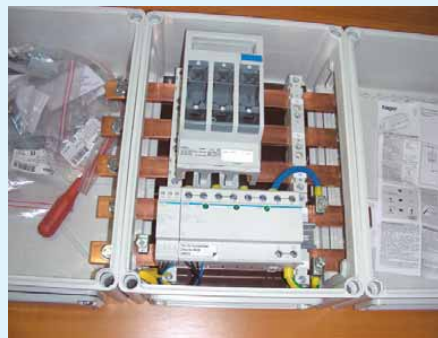
10 Neue Gehäuse für die Installation von Blitzstromableitern bei Gebäudeeintritt