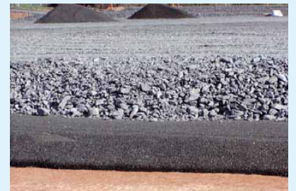
1 Schnitt durch die unterschiedlichen Erdschichten auf einer Baustelle – sichtbar ist, wie unterschiedlich die Widerstände der Erde in unterschiedlichen Tiefen sein können

Beispiel: Bei Probegrabungen kann man evtl. auch die „Verbesserungsmaßnahmen“ der errichtenden Blitzschutzbaufirma feststellen. Im Bild 2 ist zu erkennen, dass die Installationsfirma der Erdungsanlage unterhalb der Trennstelle im Trennkasten noch eine Verbindung zwischen dem Erder und der Ableitung herstellte. Somit schuf die Installationsfirma für immer einen guten „Erdungswiderstand“. Dieser wurde jahrelang von einer Prüforganisation als guter Widerstand gemessen oder auch nicht gemessen.