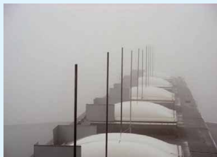
5 Zu viele Fangstangen an Dachfenstern