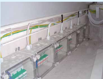
14 Nicht nur die Anschluss- und Erdungsleitungen sind zu lang und parallel geführt, auch die Potentialausgleichsschiene im Hintergrund war nicht geerdet!