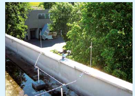
6 Geschütztes Windmessgerät an einer PVC-Außenkante