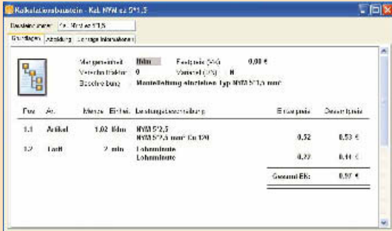
3 Kalkulationsbaustein – Stammdaten des Programms