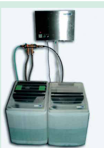
2 IMECA-System decontron